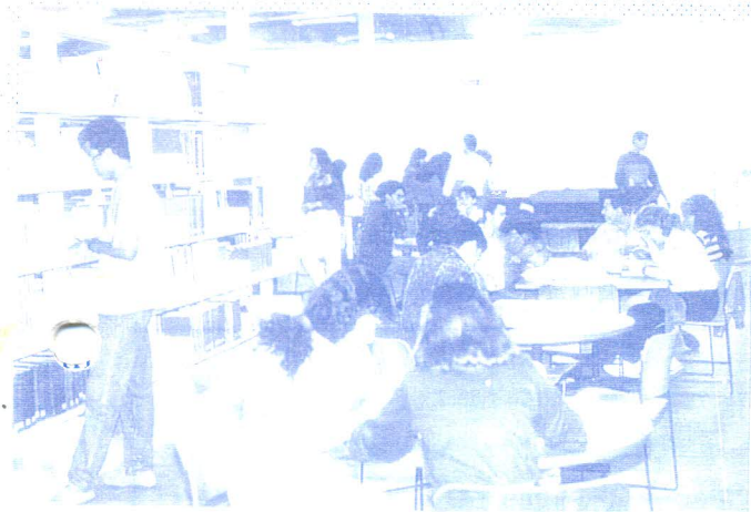
Coleção Geral - Acesso livre

BIBLIOTECA CENTRAL: Superando desafios Conheça a trajetória da BC em seus 18 anos de existência