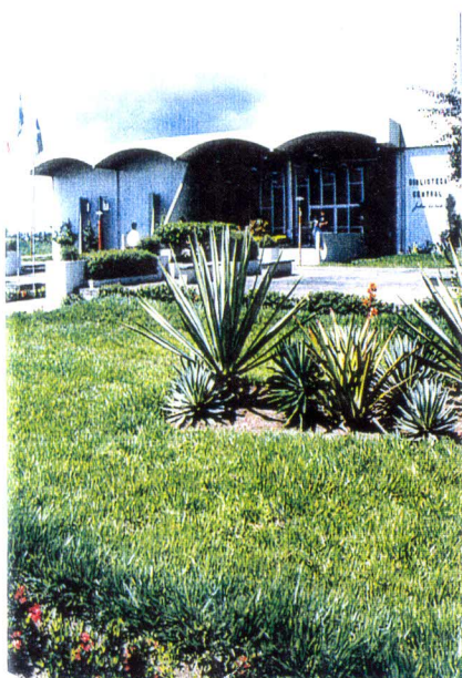
Biblioteca Central Julieta Carteado

O SISTEMA DE BIBLIOTECAS DISPONIBILIZA SEU ACERVO DE MAIS DE 100.000 VOLUMES NA BASE SISBI / UEFS