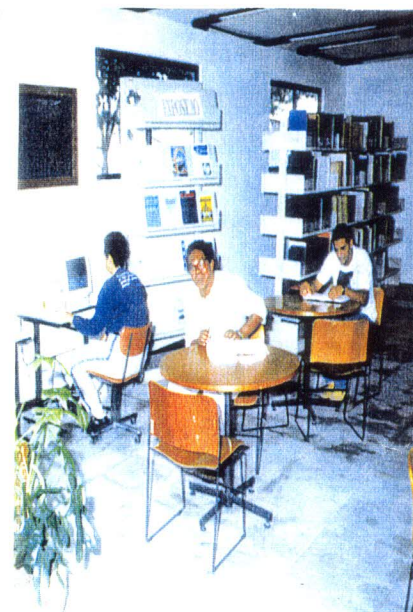
Biblioteca do Observatório Astronômico Antares